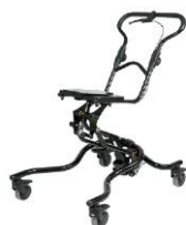
Podstawa typu Booster (JCM)