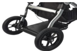
Stolik na respirator montowany centralnie pod ramą wózka