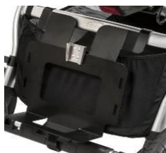
Podstawa pod respirator LTV lub Trilogy