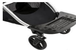
Praktyczna platforma montowana z przodu