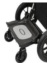
Platforma na akcesoria montowana z tyłu