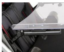
Stolik, zdejmowany, z regulacją wysokości