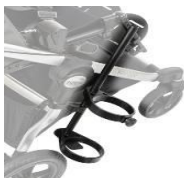
Uchwyt na butlę tlenową