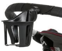
Uchwyt na kubek