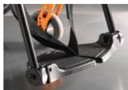
Dzielone, kompozytowe podnóżki