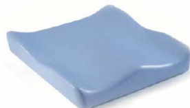
Jay Soft Combi P (na zdjęciu bez pokrowca)