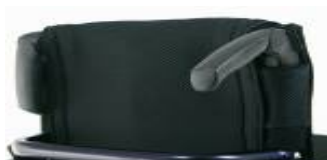
Składane rączki do