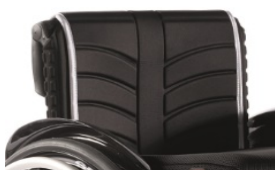
Tapicerka EXO standardowa