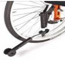
Kółko anti-wyrotne odchylane