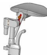
Przystawka dla amputantów