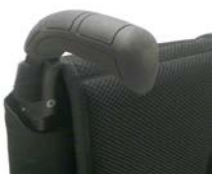
Długie rączki do prowadzenia