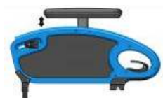
Podłokietnik stolikowy w regulacji wysokości z poduszką 250 mm)