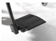
Dzielone, aluminiowe podnóżki