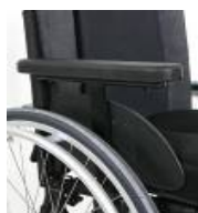
Podłokietnik na jednym słupku z regulacją wysokości