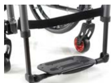
Lekka kompozytowa platforma podnóżka z regulacją kąta i głębokości