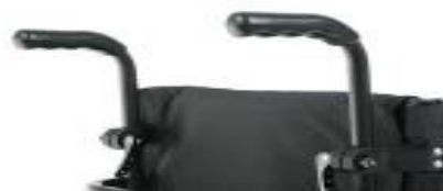
Rączki do prowadzenia z regulacją wysokości