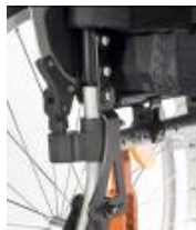
Oparcie z regulacją kąta -12° do 12°