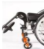
Podnoszony uchwyt podnóżka