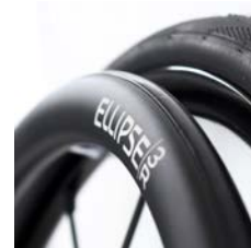
Ellipse 3R Handrim