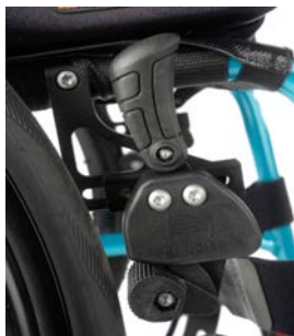
Dźwignia blokady na wysokości kolan