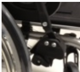
Hamulec blokowany jedną ręką