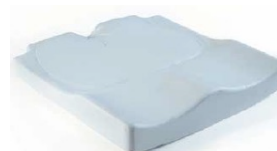
Jay Easy Visco (na zdjęciu bez pokrowca)