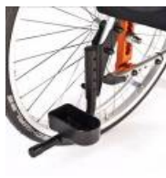
Uchwyt na kulę