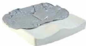
Jay Easy Fluid (na zdjęciu bez pokrowca)