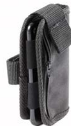
Pokrowiec na telefon komórkowy