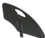
Kompozytowa odczepiana osłona boczna