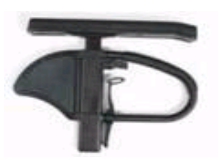
Podłokietnik z regulacją wysokości