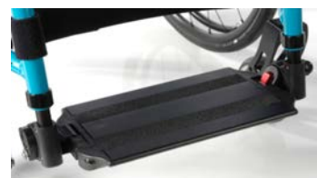
Platforma aluminiowa, z regulacją kąta i głębokości z systemem blokującym dla użytkowników ze spastycznością