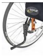
System wspomagający przy przechylaniu