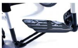
Lekka platforma podnóżka z włókna węglowego z regulacją kąta i głębokości