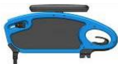
(Podłokietnik stolikowy ze stałą wysokością z poduszką 250 mm)