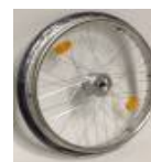
Koło z hamulcem bębnowym