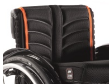
Tapicerska EXO PRO