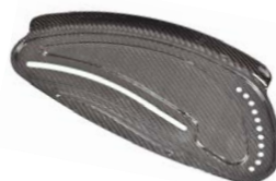
Osłona boczna z włókna węglowego z błotnikiem