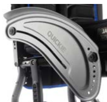
Osłona boczna aluminiowa z błotnikiem