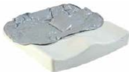
Jay Easy Fluid (na zdjęciu bez pokrowca)