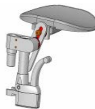
Przystawka dla amputantów