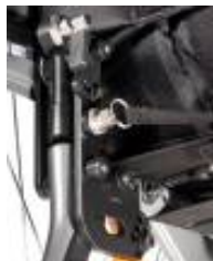
Oparcie składane z regulacją kąta, po złożeniu