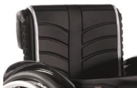
Tapicerska EXO standardowa