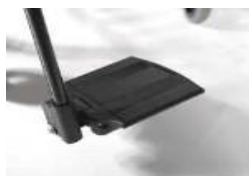
Dzielone, aluminiowe podnóżki