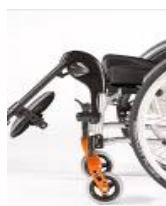
Podnoszony uchwyt podnóżka