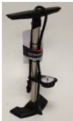
High pressure pump