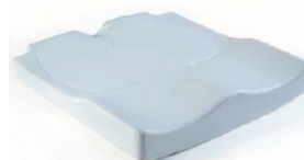
Jay Easy Visco (na zdjęciu bez pokrowca)