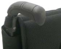
Długie ręczki do prowadzenia