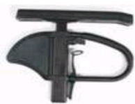
Podłokietnik z regulacją wysokości