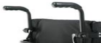
Ręczki do prowadzenia z regulacją wysokości