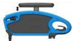
Podłokietnik stolikowy w regulacji wysokości z poduszką 250 mm)