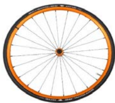
Lightweight wheel, anodized orange