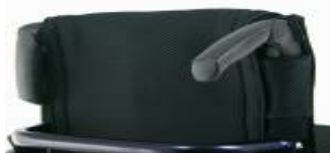
Składane ręczki do prowadzenia