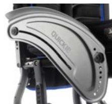
Osłona boczna aluminiowa z błotnikiem