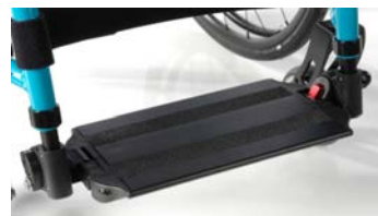
Platforma aluminiowa, z regulacją kąta i głębokości z systemem blokującym dla użytkowników ze spastycznością