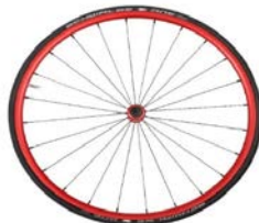
Lightweight wheel, anodized red