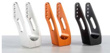
Widelce aluminiowe srebrny, pomarańczowy, czarny