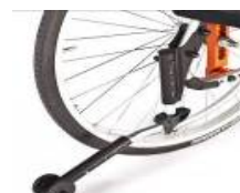
Kółko antywywrotne odchylane