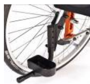
Uchwyt na kulę