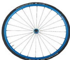
Lightweight wheel, anodized blue