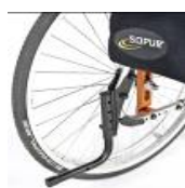
System wspomagający przy przechylaniu