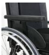
Podłokietnik na jednym słupku z regulacją wysokości