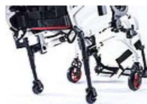
XFF090010 Kółka tranzytowe