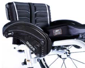
XFF040104 Z włókna węglowego, z ochroną ubrań, z błotnikiem