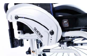
XFF040103 alumiowa z ochroną ubrań i błotnikiem