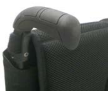
XFF 030201 Długie rączki do prowadzenia