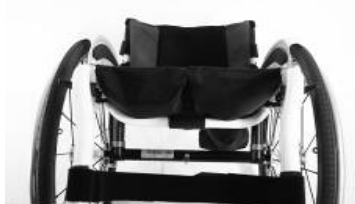
XFF 020003 tapicerka siedziska z 2 kieszeniami