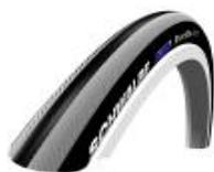
XFF070101 Schwalbe Right Run