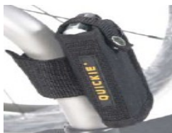
XFF090026 Kieszonka na telefon komórkowy