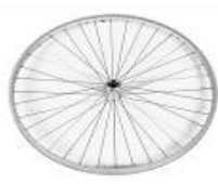
XFF070002 Koła z polerowaną piastą