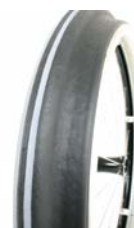
XFF070208 Ciagi Maxgrepp