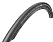
XFF070107 Schwalbe One