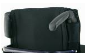
XFF 030203 Składane rączki do prowadzenia