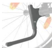
XFF090001 Rurka wspomagająca przy przechylaniu