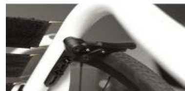
XFF060004 Hamulec kompaktowy, lekki