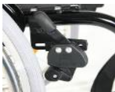
XFF060002 Dźwignia blokady hamulca na wysokości kolan