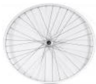
XFF070001 Koła Uniwersalne