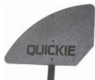
XFF040107 Kompozytowa osłona boczna, odpinana