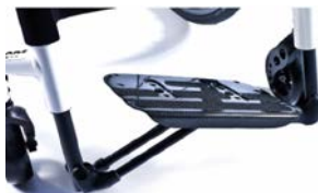
XFF050027 Lekka platforma podnóżka z włókna węglowego, odchylana