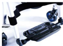
XFF050132 Lekka platforma podnóżka z włókna węglowego