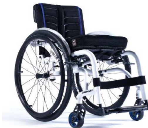
XFF090020 / 21 Rama hybrydowa