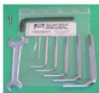
XFF090000 Zestaw narzędzi