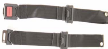
XFF 090018 Pas stabilizujący z metalową klamrą