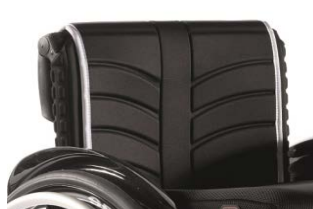
XFF 030316 tapicerka siedziska EXO