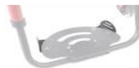
XFF050127 Płytki pozycjonujące stopy