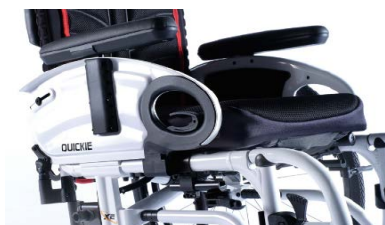
XFF04000x Podłokietniki stolikowe, z poduszką, odchylane do góry, zdejmowane