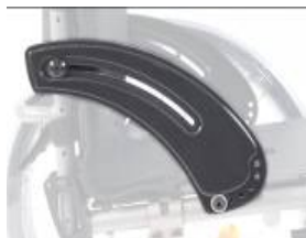
XFF040101 wąska osłona z włókna węglowego z ochroną ubrań