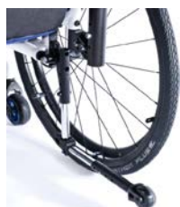
XFF090004 Kółka antywywrotne odchylane