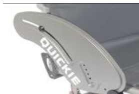
XFF040102 alumiowa z ochroną ubrań