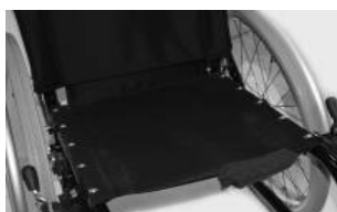
XFF 020002 tapicerka siedziska z 1 kieszenią