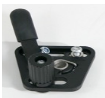
XFF060001 Hamulec standardowy