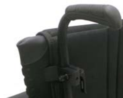
XFF 030204 Rączki do prowadzenia z regulacją wysokości