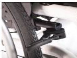
XFF060003 Hamulec kompaktowy