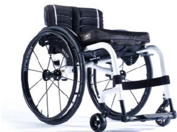
XFF010012 / 13 Rama otwarta