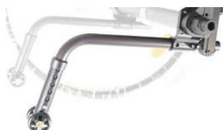
XFF090050 Odkładane kółka antywywrotne