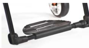
XFF050059 Platforma podnóżka typu performance