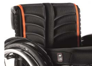
XFF 030317 tapicerka siedziska EXO PRO