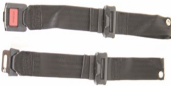
XFF 090018 Pas stabilizujący z metalową klamrą