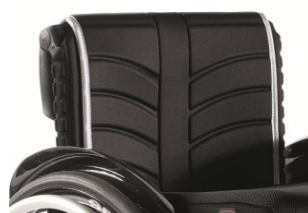
XFF 030316 tapicerka siedziska EXO