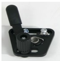
XES060001 Hamulec standardowy