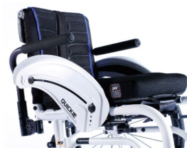
XES040117 Podłokietnik rurowy, odchylany, zdejmowany, wycielany