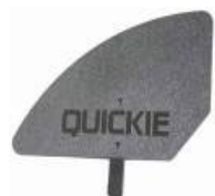
XES040107 Kompozytowa osłona boczka, odpinana