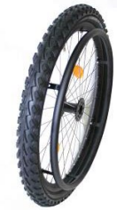
XES07010 Koło górskie