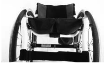
XFF 020003 tapicerka siedziska z 2 kieszeniami