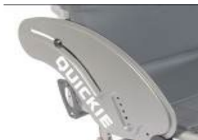
XES040102 Wąska osłona z włókna węglowego z ochroną ubrań