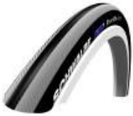
XES070101 Schwalbe Right Run