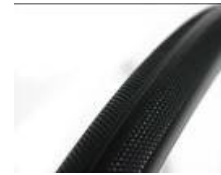
XES070102 Opona odporna na przebicia (pełna)