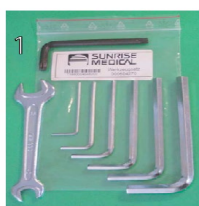
XES090000 Zestaw narzędzi