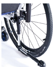
XES090004 Kółka antywywrotne odchylane