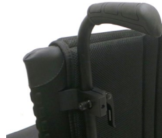
XFF 030204 Rączki do prowadzenia z regulacją wysokości