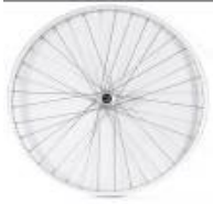
XES070001 Koło Uniwersalne