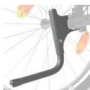
XES090001 Rurka wspomagająca przy przechyleniu