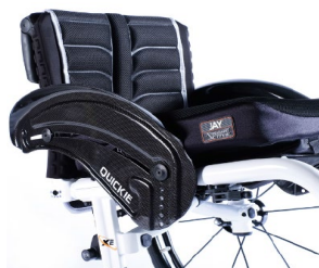
XES040104 Błotnik z włókna węglowego, z ochroną ubrań