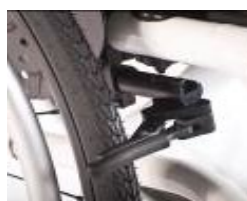
XES060003 Hamulec kompaktowy