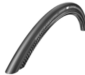
XES070107 Schwalbe One