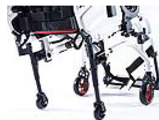
XES090010 Kółka tranzytowe