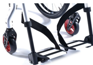
XES050022 Platforma podnóżka dzielona, odchylana, w kolorze ramy