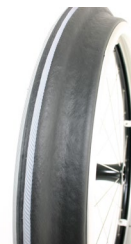
XES070208 Ciągi Maxgrepp