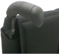
XFF 030201 Rączki do prowadzenia z długą rękojeścią