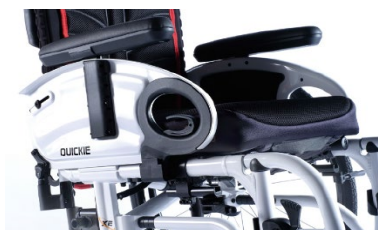
XES04000x Podłokietnik stolikowy, z poduszką, odchylany do góry, zdejmowany