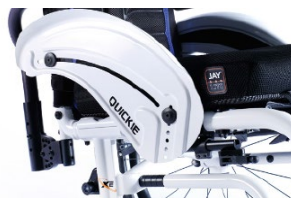
XES040103 Aluminiowa z ochroną ubrań