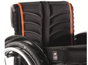
XFF 030317 tapicerka siedziska EXO PRO