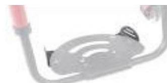
XES050127 Płytki pozycjonujące stopy