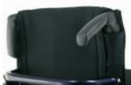
XFF 030203 Składane rączki do prowadzenia