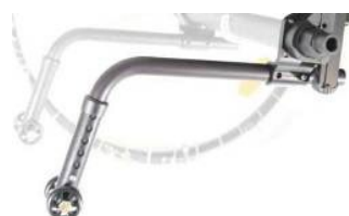
XES090050 Odłączane kółka antywywrotne