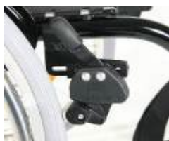
XES060002 Dźwignia blokady hamulca na wysokości kolan