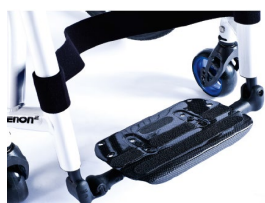
XES050132 Lekka platforma podnóżka z włókna węglowego