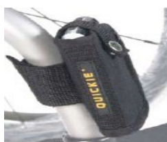
XES090026 Kieszka na telefon komórkowy