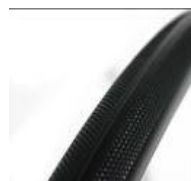
XFF070102 Opony odporne na przebiecia