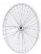
XFF070001 Koła Uniwersalne