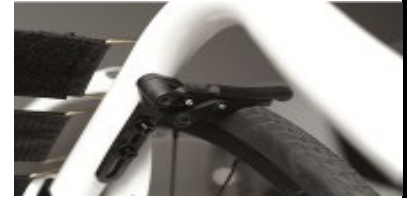
XFF060004 Hamulec kompaktowy, lekki