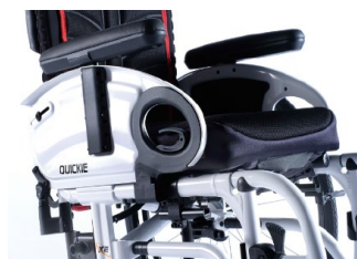
XFF04000x Podłokietniki stolikowe, z poduszką, odchylane do góry, zdejmowane