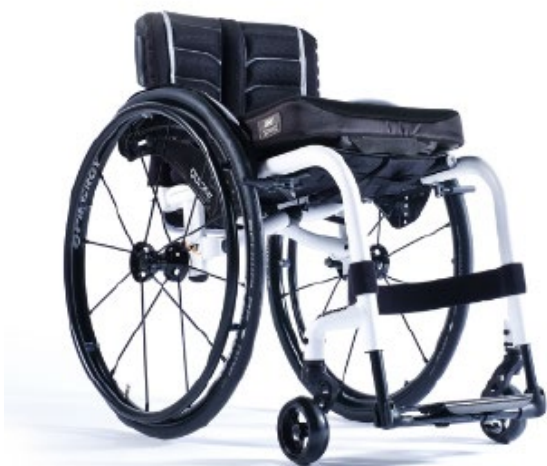
XFF010012 / 13 Rama otwarta