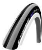
XFF070101 Schwalbe Right Run