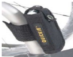
XFF090026 Kieszka na telefon komórkowy