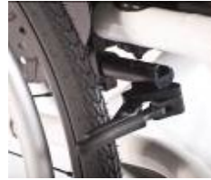
XFF060003 Hamulec kompaktowy