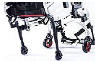
XFF090010 Kółka tranzytowe