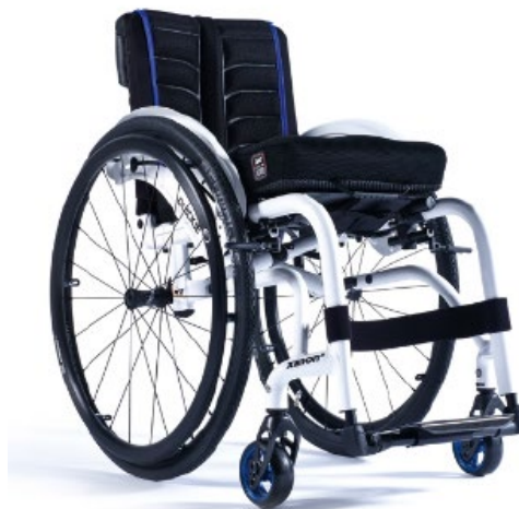
XFF090020 / 21 Rama hybrydowa