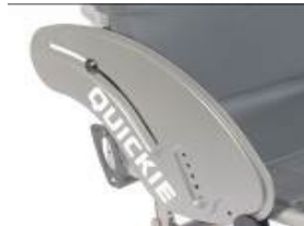
XFF040102 alumiuniowa z ochroną ubrań