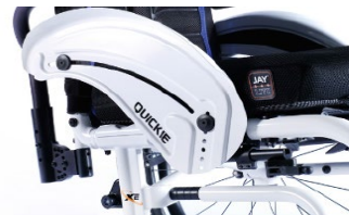
XFF040103 alumiuniowa z ochroną ubrań i błotnikiem