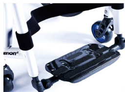
XFF050132 Lekka platforma podnóżka z włókna węglowego