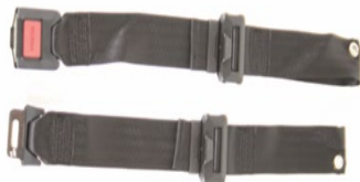
XFF 090018 Pas stabilizujący z metalową kłamrą