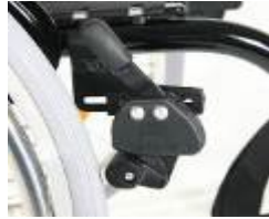
XFF060002 Dźwignia blokady hamulca na wysokości kolan