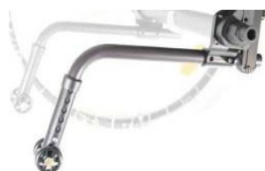
XFF090050 Odlączane kółka antywyrotne