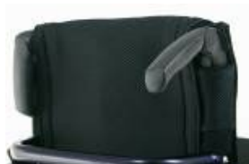
XFF 030203 Składane rączki do prowadzenia