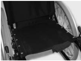
XFF 020002 tapicerka siedziska z 1 kieszenią