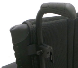
XFF 030204 Rączki do prowadzenia z regulacją wysokości