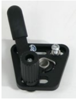
XFF060001 Hamulec standardowy