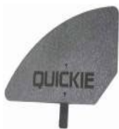
XFF040107 Kompozytowa osłona boczna, odpinana