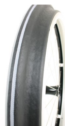
XFF070208 Ciągi Maxgrepp