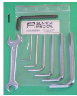
XFF090000 Zestaw narzędzi