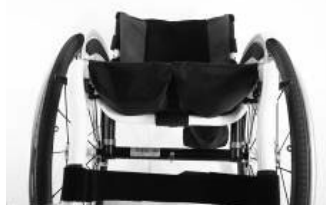
XFF 020003 tapicerka siedziska z 2 kieszeniami