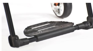
XFF050059 Platforma podnóżka typu performance