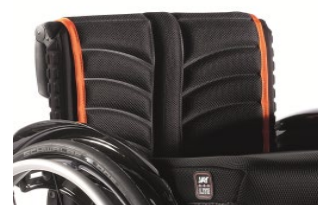
XFF 030317 tapicerka siedziska EXO PRO