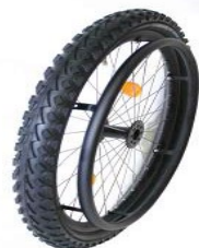
XFF07010 Koła górskie