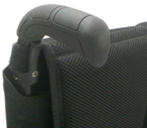
XFF 030201 Długie rączki do prowadzenia