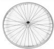
XFF070002 Koła z polerowaną piastą