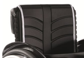
XFF 030316 tapicerka siedziska EXO