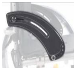
XFF040101 wąska osłona z włókna węglowego z ochroną ubrań