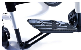
XFF050027 Lekka platforma podnóżka z włókna węglowego, odchylana