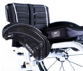
XFF040104 Z włókna węglowego, z ochroną ubrań, z błotnikiem