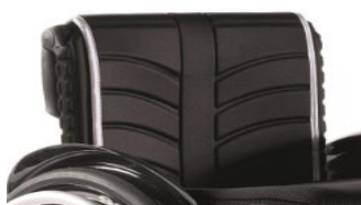
Tapicerka EXO standardowa