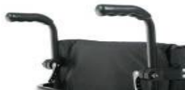
Rączki do prowadzenia z regulacją wysokości