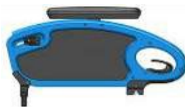
(Podłokietnik stolikowy ze stałą wysokością z poduszką 250 mm)