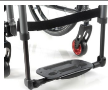
Lekka kompozytowa platforma podnóżka z regulacją kąta i