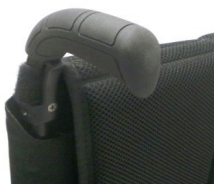
Długie rączki do prowadzenia