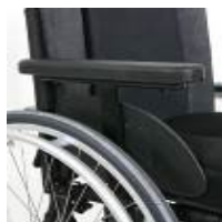
Podłokietnik na jednym słupku z regulacją wysokości