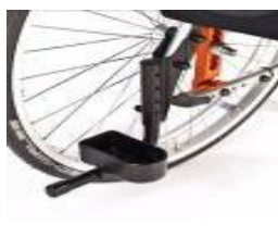
Uchwyt na kulę