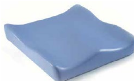
Jay Soft Combi P (na zdjęciu bez pokrowca)