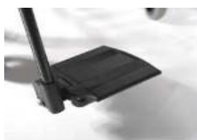
Dzielone, aluminiowe podnóżki