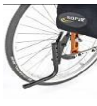
System wspomagający przy przechylaniu