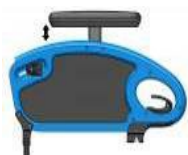
Podłokietnik stolikowy w regulacji wysokości z poduszką 250 mm