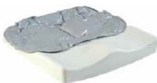
Jay Easy Fluid (na zdjęciu bez pokrowca)