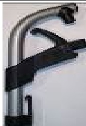
Uchwyty podnóżka 70°/80°