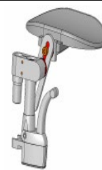
Przystawka dla amputantów