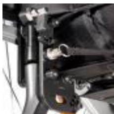
Oparcie składane z regulacją kąta, po złożeniu