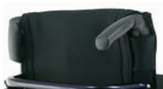
Składane rączki do naniaies