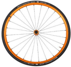
Lightweight wheel, anodized orange