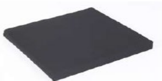
Poduszka siedziska z pokrowcem