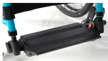
Platforma aluminiowa, z regulacją kąta i głębokości z systemem blokującym dla użytkowników ze spastycznością