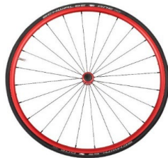
Lightweight wheel, anodized red