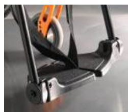
Dzielone, kompozytowe podnóżki