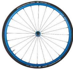
Lightweight wheel, anodized blue