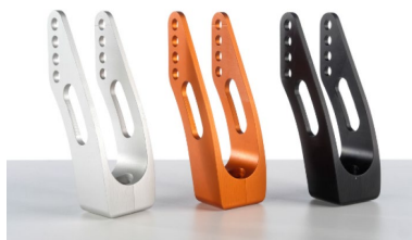
Widelce aluminiowe srebrny, pomarańczowy, czarny