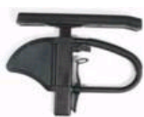
Podłokietnik z regulacją wysokości