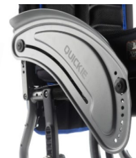
Osłona boczna aluminiowa z