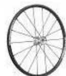
Koło Spinergy 18-szprychowe