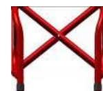
Rama FF 85° aktywna, taliowanie 2 cm