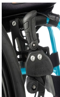
Dźwignia blokady na wysokości kolan