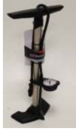
High pressure pump