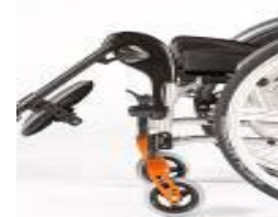
Podnoszony uchwyt podnóżka