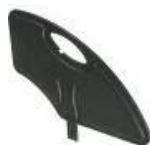
Kompozytowa odczepiana osłona boczna