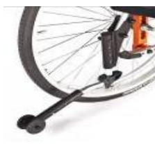
Kółko antywywrotne odchylane