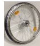
Koło z hamulcem bębnowym