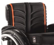
Tapicerska EXO PRO