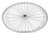
Koło z polerowaną piastą