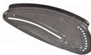
Osłona boczna z włókna węglowego z błotnikiem