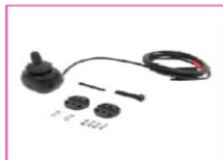
EU102/107 mo-Vis all-round joystick light