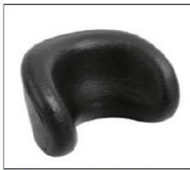
EL013/EL014 Head support with ABS exterior shell