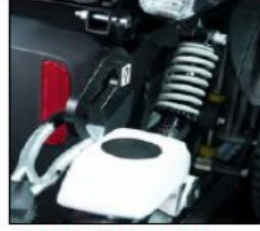
ES002 Kit for vehicle transport