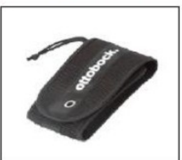
ES003 Pocket for mobile phone