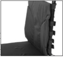
EC001 - EC004 Standard seat