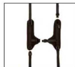
EP014 - EP017 Shoulder harness

Firma Otto Bock Polska zastrzega sobie możliwość dokonywania zmian w konfiguracji zamówienia w pełnym porozumieniu z zamawiającym na wypadek niemożności dostarczenia pierwotnej wersji konfiguracji.