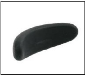
EL006 Head support