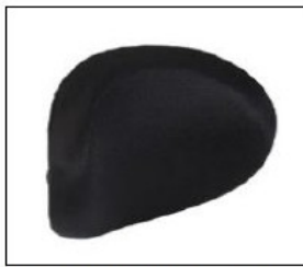
EL011/EL012 Head support