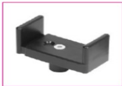
EU080 Fork for tetraplegics, horizontal