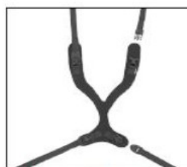
EP011 - EP013 Slimline sternum harness