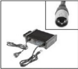
EU044 Battery Charger