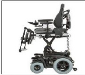
EC026 Seat height adjustment 35 cm