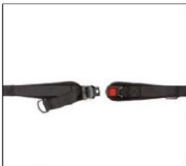
EP002 Lap belt, metal buckle