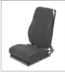
EC020/ED034 Flat contoured