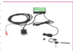
EU100/105 mo-Vis micro-joystick