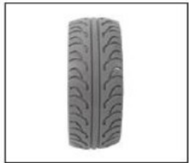
EG015 Caster wheel with ribs