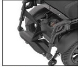
EB007 Individual aluminum foot plate