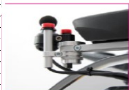
EU110-113 Holder for arm support