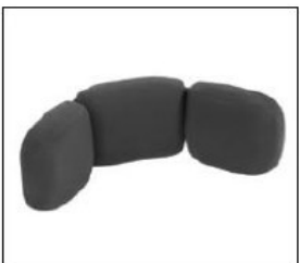
EL020 Head support, angle-adjustable