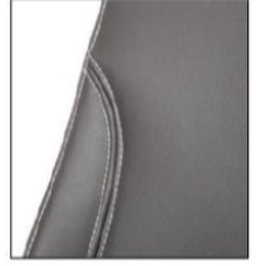
EC023/ED038 Synthetic leather cover