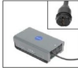
EU042 Battery Charger