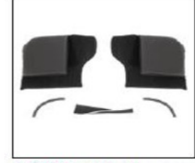
ES013 Dahl docking system installation kit