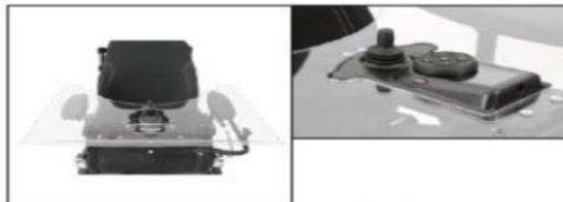
EU063 TEN° tray module, electrical flip over