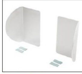
ED039 Side panels