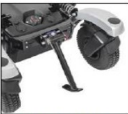
EF021 Curb climbing assist