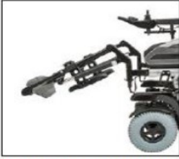
EB003 Power elevating, separate control