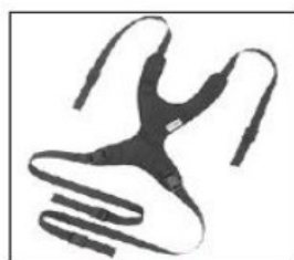
EP008 - EP010 Sternum harness