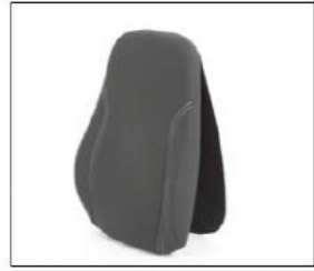
ED050/ED051 Contour back support pad AD