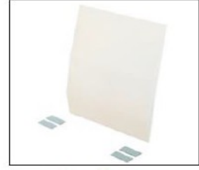
ED040 Lumbar support