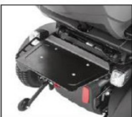
ES004 Luggage carrier