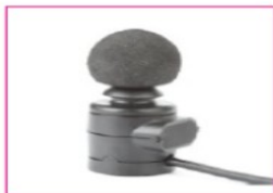
EU101/106 mo-Vis multi-joystick