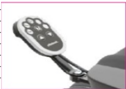
EU098 Button module