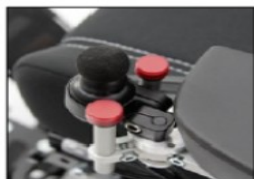
EU111 mo-Vis Joystick incl. 2 finger buttons