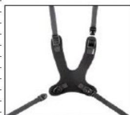
EP005 - EP007 Dynamic harness