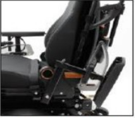
EE024 Flip-up arm support