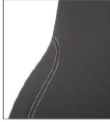
EC022/ED037 Fabric cover