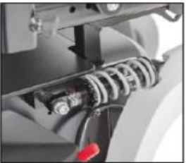
EF001 Caster wheel swing arm, spring-mounted