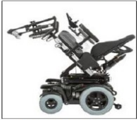
EC025 45° seat tilt