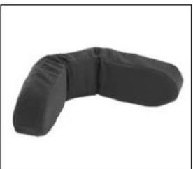
EL017 Head support, concave