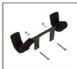
ES005 Crutch holder