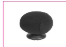
EU082 Soft ball, black cover