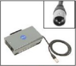
EU041 Battery Charger