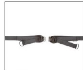
EP003 Lap belt, plastic buckle