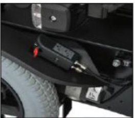
EF020 Caster wheel swivel lock