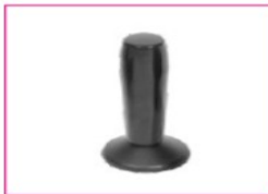
EU081 Stick S80