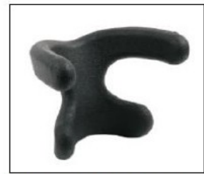
EL015/EL016 X-shaped head/neck support