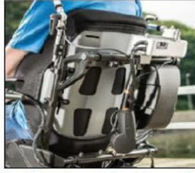
ED036 Baxx aluminium flat top back support