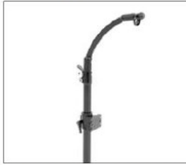
EL005 Rock-n-Lock flip down