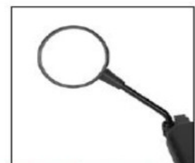
ES006 Rearview mirror