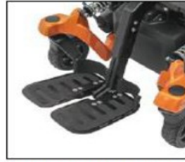
EB013 Centrally mounted leg support