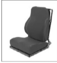
EC021/ED035 Deep contoured