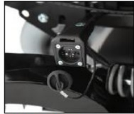
EU043 External magnetic charging receptacle